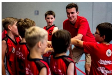
Basketball-Huddle kurz vor dem Spiel bei der Grundschulliga des Post SV Nürnberg.

Der TORNADOS FRANKEN e.V. nutzt die Potentiale seiner Partnervereine, um junge Talente effektiver zu fördern. Die Basis dieses Erfolges bildet die Miniarbeit (Altersklasse unter 12 Jahren), die im Grundschulbereich in den Projekten DURCHSTARTEN mit BASKETBALL beim Post SV Nürnberg, bei den Piranhas Ansbach, beim TV Fürth und bei den Fibalon Baskets Neumarkt, sowie bei der SpVgg Roth