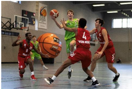
Die JBBL schlägt den amtierenden Deut- schen Meister im Season Opening 2019/20.

Die U16 qualifizierte sich im Sommer 2018 endlich und erlösenderweise nach dem dritten Versuch der Vereinsgeschichte für die Jugend Basketball Bundesliga (JBBL). Die hart erarbeitete Ligateilnahme konnte in der folgenden Premiersaison durch die souveränen Siege in den entscheidenden Playdown-Spielen mit dem Klassenerhalt und dem Teilnahme-recht für die Saison 2019/20 erfolgreich abgeschlossen werden. Ein paar Eindrücke zur vergangenen Saison in bewegten Bildern vom Derby Nürn-berger Basketball Club gegen TORNADOS FRANKEN, das den Ligazuschau-errekord in der Vorrunde der Saison 2018/19 hält, finden Sie hier .