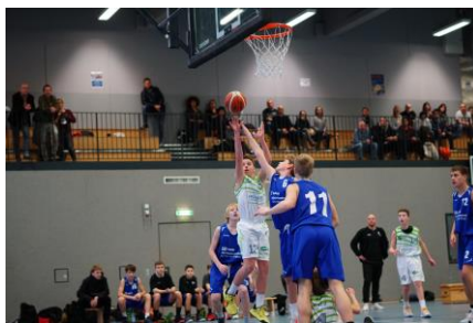
Die U14 Bayernliga im Heimspiel gegen den Bundesliganachwuchs aus Würzburg.

Die gute Miniarbeit mündet schließlich in der U14 Bayernliga-Mannschaft (höchste Liga in der Altersklasse) der TORNADOS FRANKEN, die sich in der Saison 2017/18 und 2018/19 mit dem 3. Platz bei den Bayerischen Meisterschaften belohnte und sich somit direkt das Teilnahmerechte für die folgende Spielzeit in der Liga sicherte.