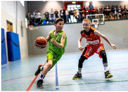
Die U10 und U12 sind heiß auf den Wettkampf gegen die großen Basketballnamen aus München, Bamberg, Frankfurt und Ulm

Um den aktuell auffälligsten U10 und U12 Spielern aller Partnervereine die Möglichkeit zu geben sich auf ihrem Spielniveau zu messen und essentiellen Wettkampf auf Augenhöhe zu sammeln, wurde die TORNADOS FRANKEN MiniChallenge ins Leben gerufen. Bei diesem zur Saison 2018/19 neu geschaffenen Turnierformat tritt die U10 und U12 TORNADOS FRANKEN „Besten-Mannschaft“, bestehend aus einem 15er Kader, mindestens 2-mal