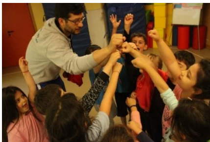
Abschluss-Huddle in der Ballsporteinheit des Projektes Rotary AktivKIDS

Das Projekt Rotary AktivKIDS ist eine Zusammenarbeit zwischen dem Rotary Club Nürnberg-Fürth und dem TORNADOS FRANKEN e.V. Ziel des Projekts ist es Kinder bereits im Kin- dergarten für den Spaß an Bewegung und Sport zu begeistern. Schwerpunkt ist dabei das spielerische Erlernen all- gemeiner sportlicher Fertigkeiten und in diesem Rahmen auch der Basket- ballgrundtechniken Passen, Fangen,